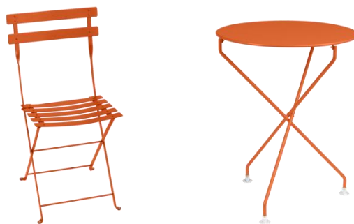
Mobilier type Fermob envisagé

Une terrasse sera matérialisée au sol par des clous bronze (identiques à ceux présents sur les terrasses du boulevard) pouvant accueillir un mobilier fin, en métal de type Fermob (à la charge de l'exploitant).