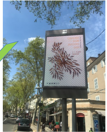
Le visuel se détache du fond, l'information est hiérarchisée.