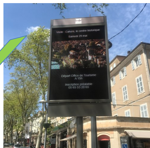
Information lisible, contrastée et hiérarchisée.