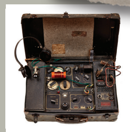
Valise émetteur- récepteur type 3 MK II (2018.0.1)