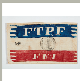
Brassard artisanal (2018.0.256)