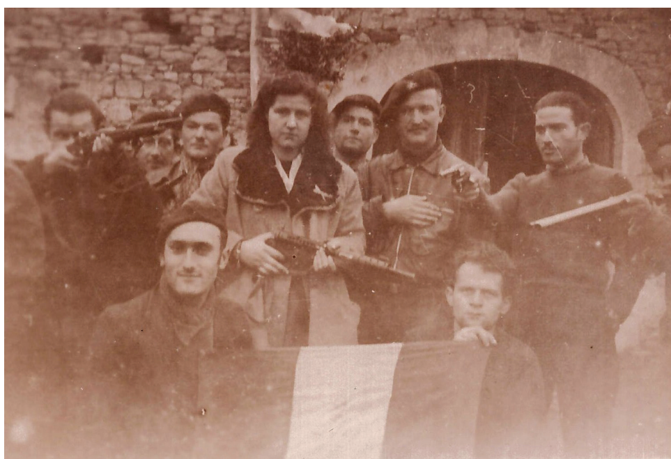
Photographie du maquis Guy Moquet, Caniac, février 1944

Ce projet ambitieux, porté par les services de la Ville de Cahors avec le soutien des partenaires institutionnels et associatifs, illustre l'engagement collectif en faveur de la transmission de la mémoire et des valeurs républicaines.