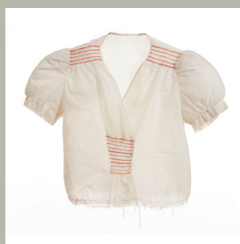
Chemisier d'enfant confectionné en toile de parachute (2018.0.698)