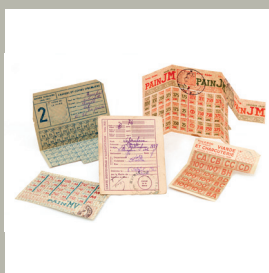
Tickets de rationnement (2018.0.236)