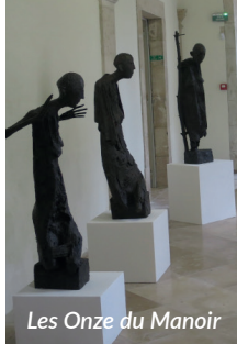
Les Onze du Manoir

Les Gargouilles, Les Epées, Les Onze du Manoir