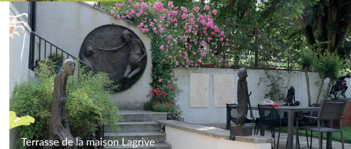
Terrasse de la maison Lagrive