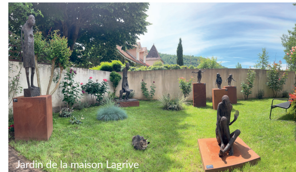
Jardin de la maison Lagrive