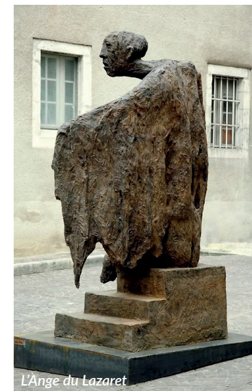
L'Ange du Lazaret