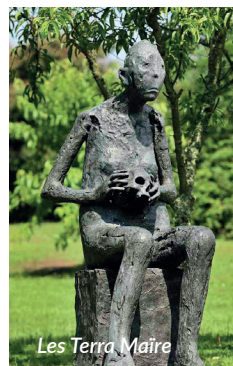
Les Terra Maire

Mémoire 1 - Mémoire 2 (accumulation de fragments des pièces créées depuis le début de sa carrière) : « La vérité recherchée et produite au travers de mes personnages, comme l'évolution d'une biographie, n'est pas figée, elle se transforme comme une ride qui se creuse. Chaque sculpture est un point d'ancrage dans la réalité d'un moment donné, une sorte de temps arrêté. J'ai besoin de ces bornes, non pour retourner sur mes pas mais pour avoir espoir et confiance dans le cheminement ». MP