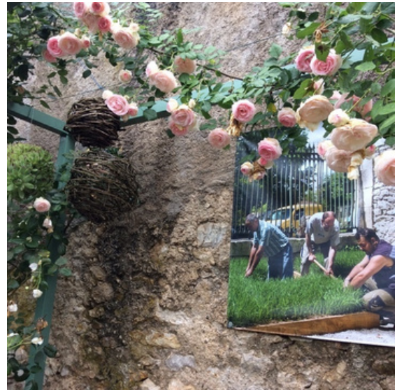
Le jardin du vieux relais - Arcambal - photo CJJ

Aujourd'hui, plus de 20 Jardins paysage figurent dans le parcours, proposant balades, visites accompagnées, lectures, ateliers... aux visiteurs. Depuis 2015, l'association Juin Jardins développe, en collaboration avec le Parc naturel régional des Causses du Quercy le Grand Cahors et désormais le PETR du Grand Quercy, les jardins paysage dans les villages, sur la base de l'échange de savoir-faire et du volontariat. Tous les jardins sont inspirés du paysage qui les entoure (sa représentation, son histoire, sa culture, son patrimoine, son biotope). Leur composition privilégie les plantes et les essences locales. Les préoccupations environnementales sont respectées et toute utilisation de pesticides ou engrais chimiques est proscrite, et ce dans un souci écologique bien compris.