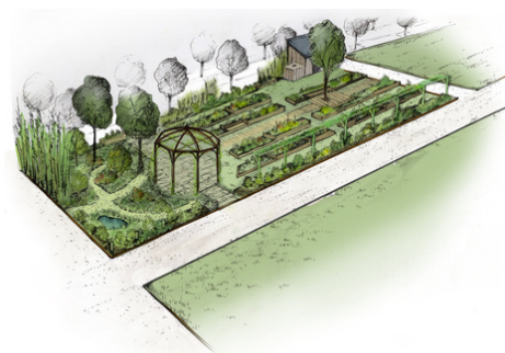
Essaimons-Demain - jardin collaboratif - Dessin Alice Freydet

Dans le cadre d'une démarche autour de la question de l'autonomie alimentaire, Juin Jardins s'associe au collectif Essaimons-Demain et participe à la conception et l'élaboration du jardin de l'Agora sur les allées Fénelon. Des ateliers jardins seront organisés pendant le festival Cahors Juin jardins dans une démarche de sensibilisation à la nature et au jardin comestible 1 .