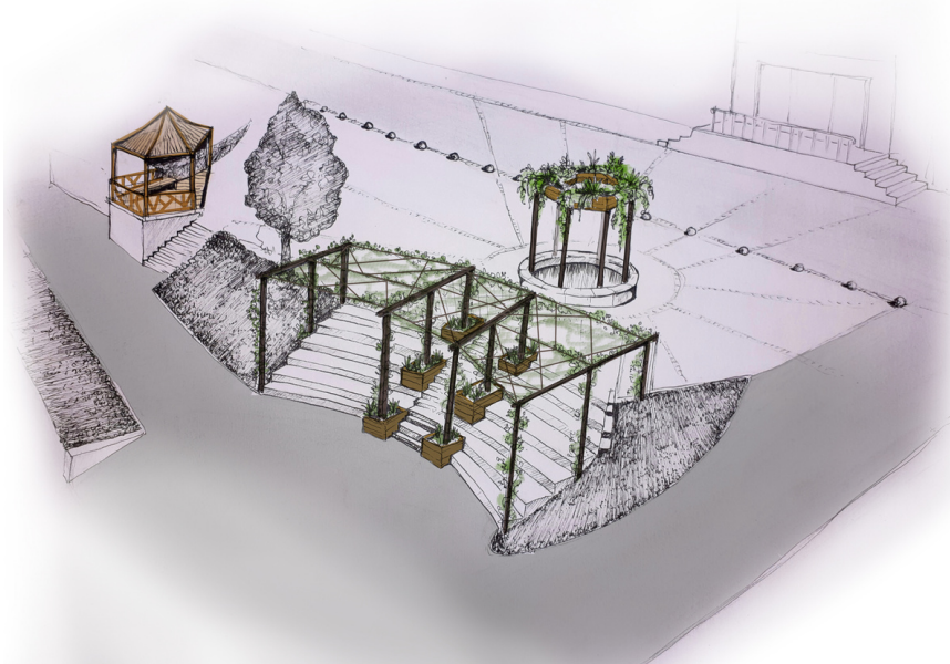
Projet d'aménagement paysager dans le cadre de la revitalisation du quartier de Sainte Valérie - dessin Alice Freytet

Le propos de cette résidence de deux mois (fractionnée sur une année), confiée au collectif Toulousain FFA (fédération française des arts) est de participer à la redynamisation du quartier de Sainte-Valérie à Cahors, à travers la création artistique, la pratique du jardinage, la notion de paysage (rural/urbain, sauvage/domestiqué, végétal/minéral), les enjeux du lien social, du vivre ensemble. Projet en cours