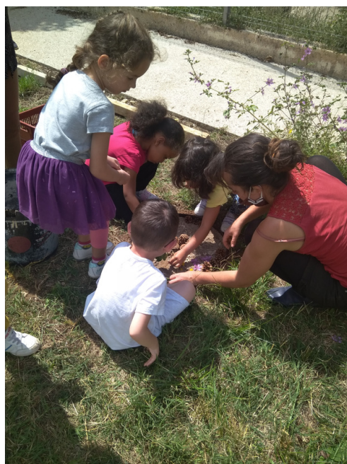
Jardin pédagogique de l'ESC de la Croix de Fer - photo Alice Freytet

Dans les quartiers de Cahors, la transition est lancée. Nouvelles zones d'habitats, créations d'espaces verts, créations d'espaces de jeux, améliorations du centre ancien... Les jardins familiaux, collectifs, partagés, pédagogiques, etc. tissent des liens, transforment le paysage urbain et mobilisent les enfants, les familles et les anciens. Avec les partenaires sociaux et les habitants, l'association Juin Jardins propose d'amorcer la transition des quartiers vers les jardins de l'entraide par un circuit formalisé qui relie les jardins familiaux, les jardins pédagogiques, les jardins partagés et les espaces sociaux. Un nouveau partenariat avec l'association Essaimons Demain autour de l'autonomie alimentaire se traduit cette année par la création d'un jardin Agora sur les allées Fénelon, ouverts à tous. Objectifs : redécouvrir la terre, la nature, le lien social et le partage. Et le sauvage!