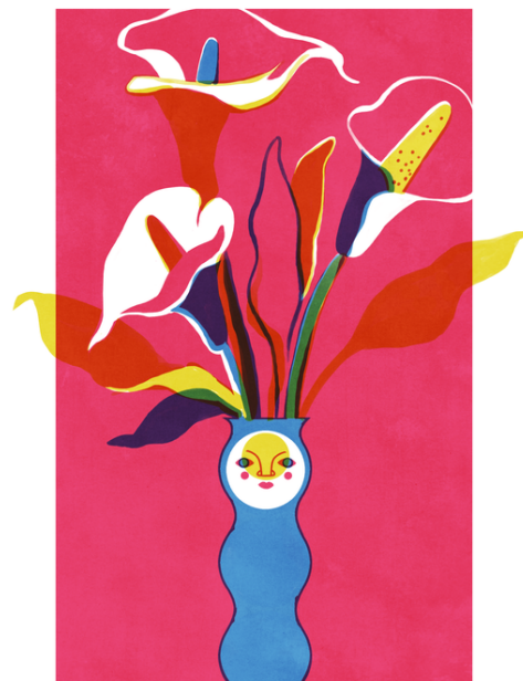
Illustration et photo @Gol3m

Etienne Caroff est l'artiste, diplômé de l'école de dessin Emile Cohl à Lyon, qui se cache derrière le nom de Gol3m. Peintre touche à tout, Gol3m aime expérimenter différents médiums tels que la sérigraphie, la peinture numérique ou la peinture sur bois, avec une prédilection pour les grandes fresques murales. Ses thèmes récurrents sont le bestiaire mythologique, l'univers de la sorcellerie, les personnages fantastiques, chimères, sorcières, hybrides mi-humain mi-animaux. Le végétal bien sûr, est récurrent, occupant les pleins et les vides de ses dessins, laissant une place au sauvage, à la transe, à la danse. La dimension Queer de son travail est omniprésente et festive. Les formes sont brutes et courbes, les couleurs vives et souvent primaires.