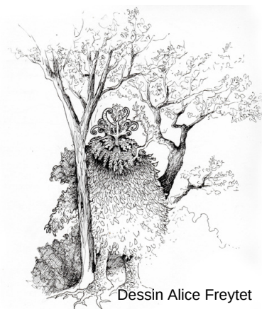
Dessin Alice Freydet

La figure de l'homme sauvage incarne ce lien ancestrale que l'humain entretenait avec la nature et qu'il a perdu. Chaque année, depuis la nuit des temps, des hommes, le temps d'une mascarade multiséculaire, entrent littéralement dans la peau du "sauvage".