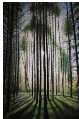
Peinture et photo @Bastien Lemaître

Entre hyper réalisme et illusion de réalité, lumière surnaturelle et nature étrange, Bastien Lemaître sème le doute. Il travaille à partir de photographies prises lors de balade en forêt ou en milieu urbain, et d'éléments de paysage saisis sur des points de vue inattendus, décalés, perturbants, qui troublent la compréhension du regardeur et l'enchantent par sa lumière. Il faut trouver la bonne distance pour saisir l'intention discrète du peintre.