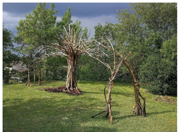
Sans titre - Bastien Lemaître

Dans le cadre de l'appel à projet régional Expérimentation culturelle de territoire menés par le pôle d'expérimentation territorial et rural (PETR), 3 villages accueillent 3 artistes dans 3 jardins paysage. Le principe est de s'installer pendant une semaine dans un village qui accueille, héberge et nourrit l'artiste et participe à la création d'une oeuvre en bois, en privilégiant les ressources locales quelles qu'elles soient. Les villages de Caillac, Arcambal et Dégagnac sont pressentis pour accueillir une oeuvre.