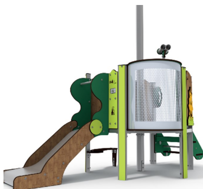
Baby 1-6 ans