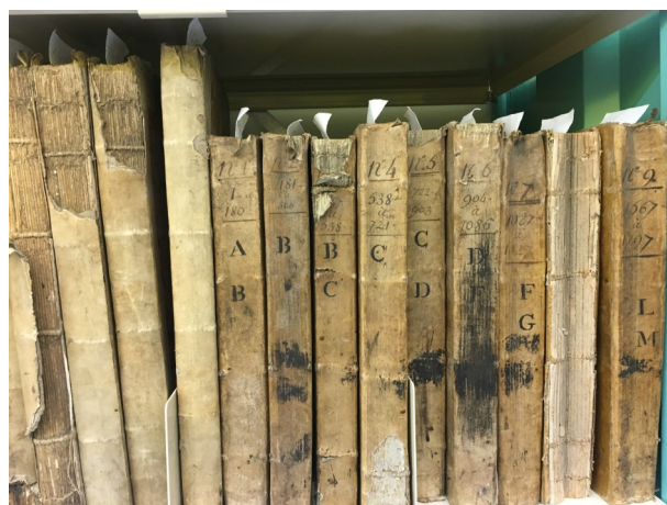
Documents fiscaux de 1791 et 1820