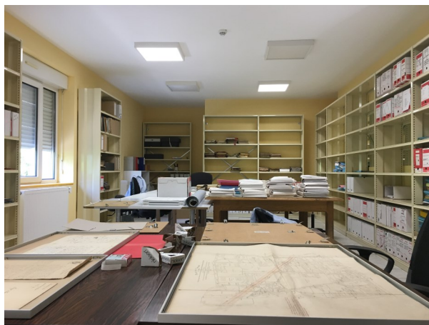
Salle de tri