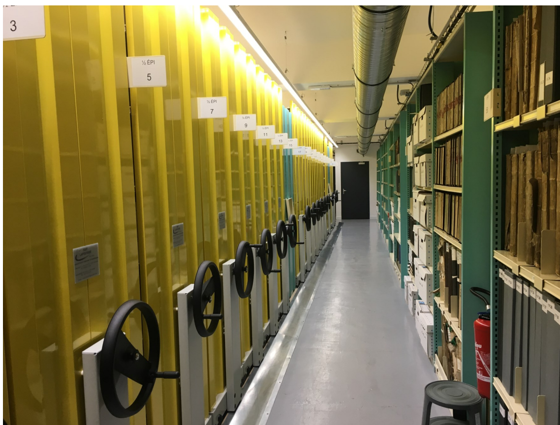
1 900 m linéaires dans le magasin de stockage.

Jeudi 4 juillet 2019, à 9 h 30 94, avenue Jean-Jaurès