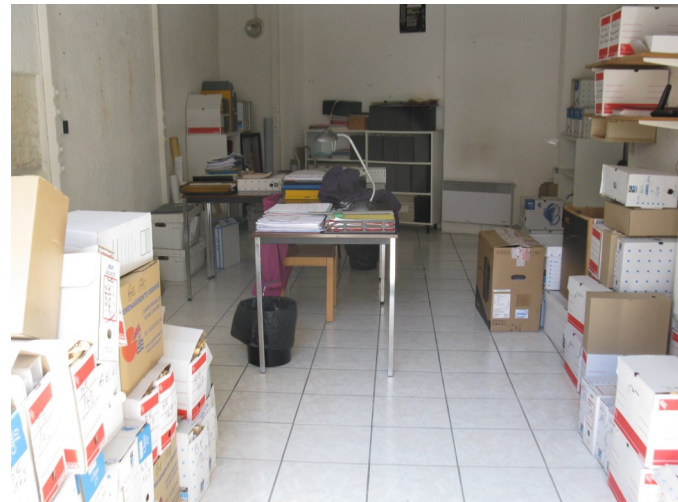
Espace de travail à l'Hôtel de ville avant le déménagement