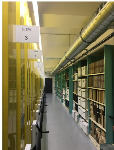
Magasin des archives avant et après le déménagement