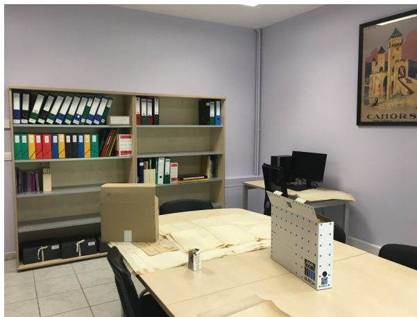
Salle de lecture