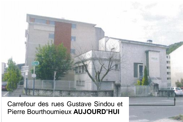
Carrefour des rues Gustave Sindou et Pierre Bourthoumieux AUJOURD'HUI