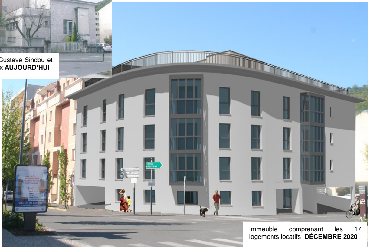
Immeuble comprenant les 17 logements locatifs DÉCEMBRE 2020

CONFÉRENCE DE PRESSE Judi 3 Octobre 2019 à 11h30 sur site